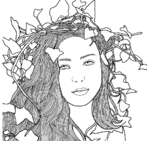
Metamorfosi elemento 2 del dittico 50x50 cm Mosaico in smalti veneziani