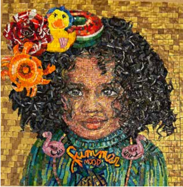
Seasons in the plastic age - Summer 50x50 cm Mosaico in smalti veneziani e vetri con foglia oro