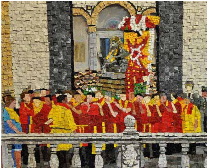
Collezione sacro Mosaico