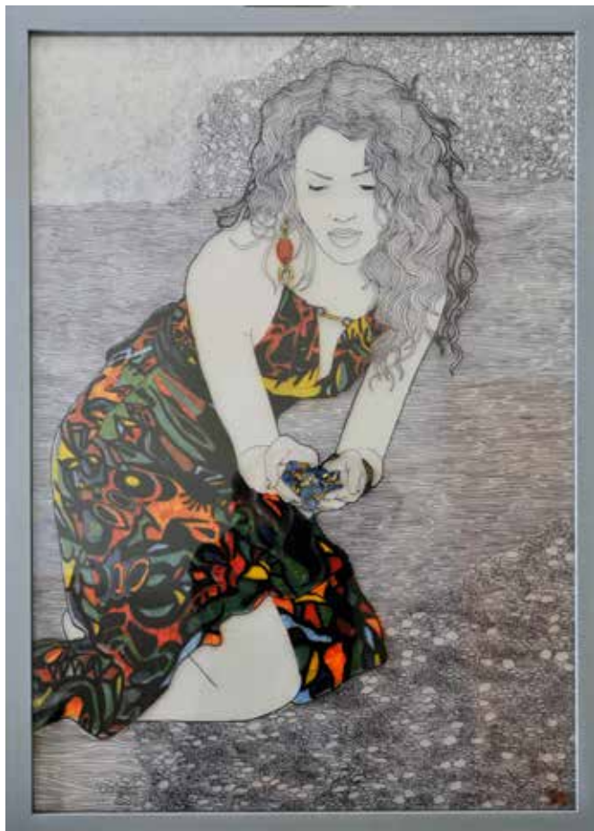
Oltre la fragilità 70x100 cm Tecnica mista