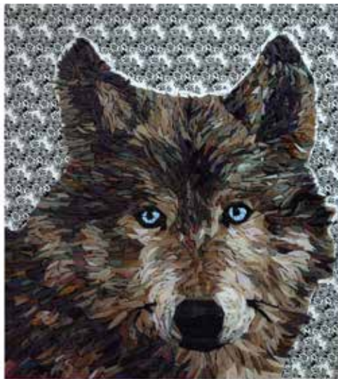
La Loba - dittico 2 pezzi 40x50 cm Tecnica mista Mosaico e plexiglass con stampa di disegno a china originale