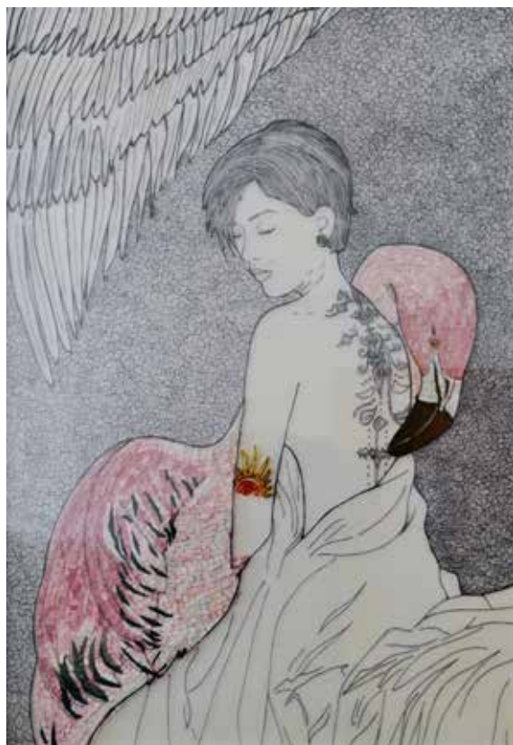
Camargue 70x100 cm Tecnica mista