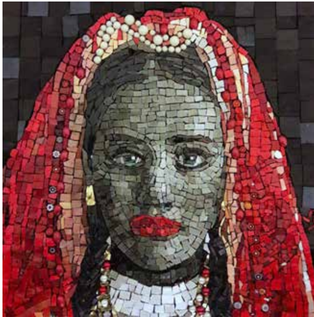
WithOUT love - 2 40x40 cm Mosaico in smalti veneziani