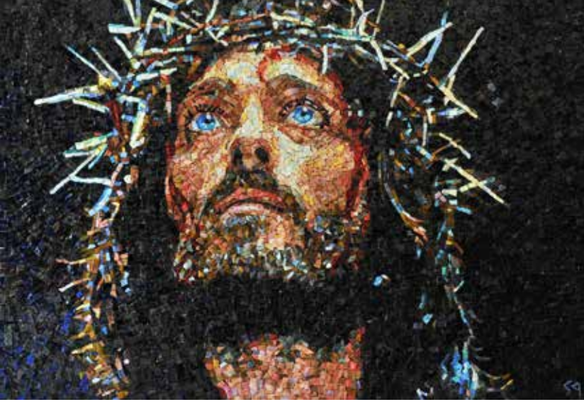
Collezione sacro Mosaico