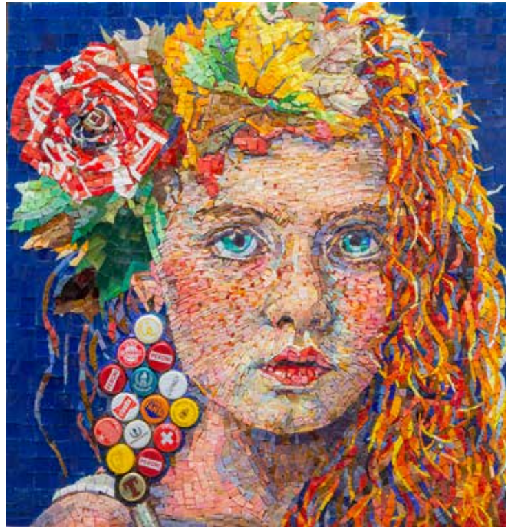
Seasons in the plastic age - Autumn 50x50 cm Mosaico