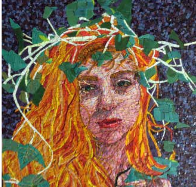
Metamorfosi elemento 1 del dittico 50x50 cm Mosaico in smalti veneziani