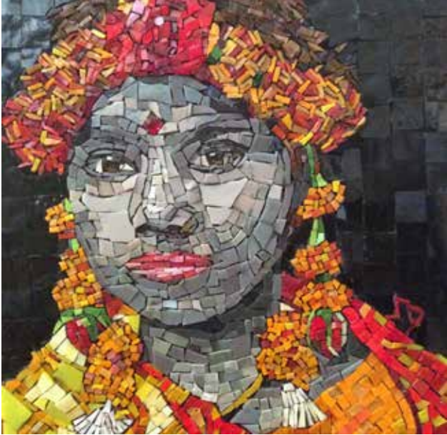
WithOUT love - 1 40x40 cm Mosaico in smalti veneziani